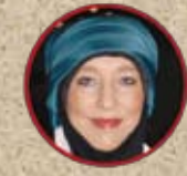
Yvonne Ridley Journaliste ayant été plusieurs fois couronnée de prix; «The Sunday Times», «The Observer», «Daily Mirror» et «Independent on Sunday». (Angleterre)