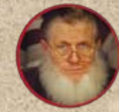
Yusuf Estes Délégué à l'ONU et prédicateur (USA)

Les personnes suivantes discuteront de ce sujet passionnant sous la direction d'Abdel Azziz Qaasim Illi sur l'estrade de la conférence annuelle du Conseil Central Islamique Suisse (CCIS):