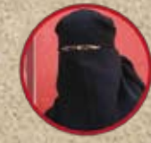
Nora Illi Département des Affaires des femmes CCIS (Suisse)